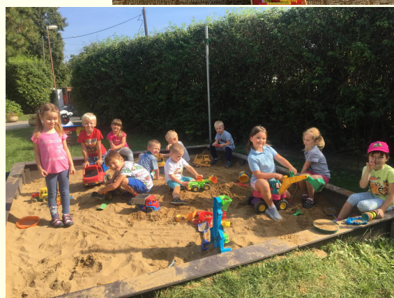
text a foto: MŠ