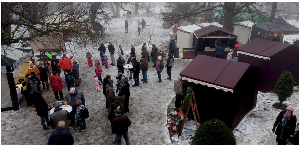
Adventní jarmark 30. 11.

K 1. prosinci 2025 vstoupila v účinnost novela zákona o pyrotechnice. Právní úprava jasně stanovuje, co obec může regulovat a co už regulovat nesmí vyhláškou. Věřím, že i bez vyhlášky se můžeme chovat ohleduplně ke svému okolí. Pokud to nepůjde, připraví městys vyhlášku vlastní.