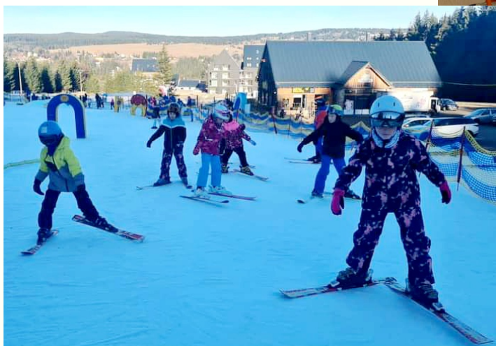
Lyžařský kurz pro 1. stupeň v lyžařském areálu na Plešivci.