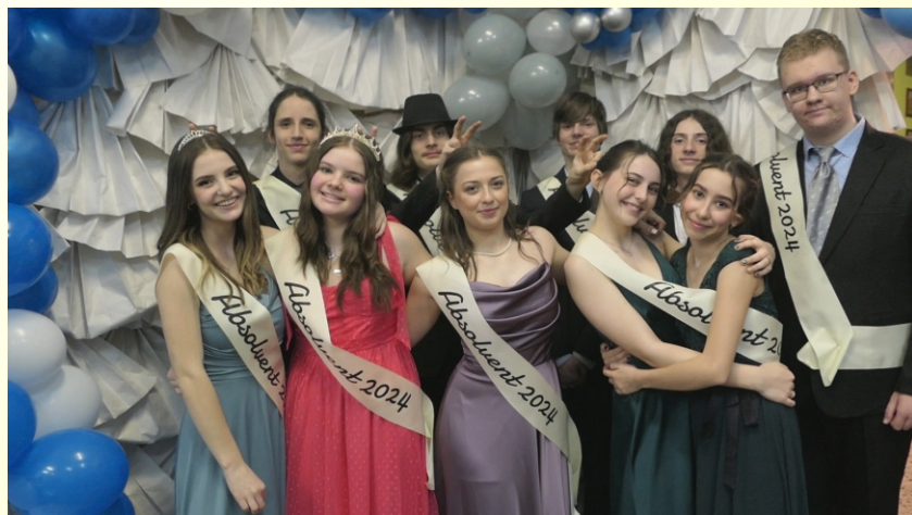
Deváťáci měli krásný ples