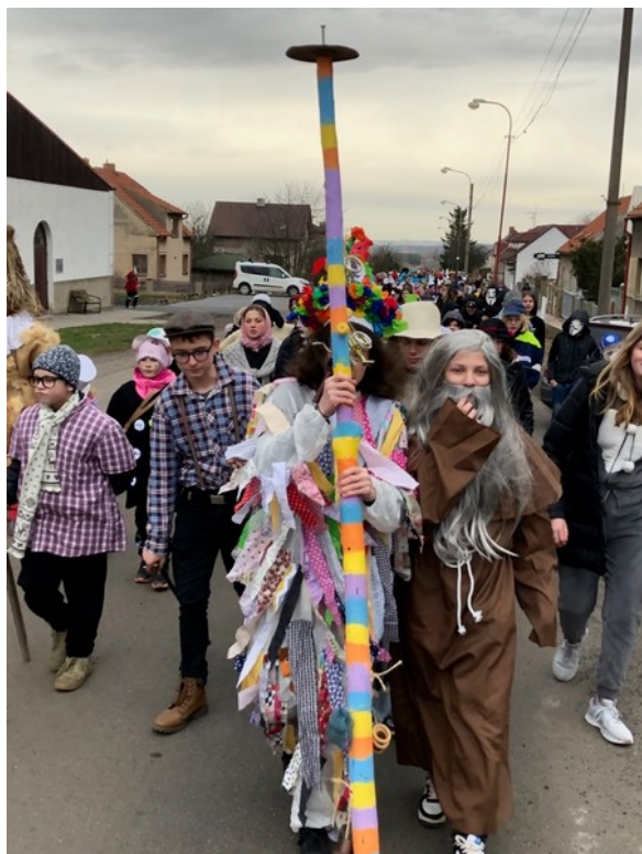
Ve středu 21. února uskutečnila základní škola ve spolupráci se školkou masopustní průvod obcí.