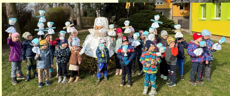
text a foto MŠ