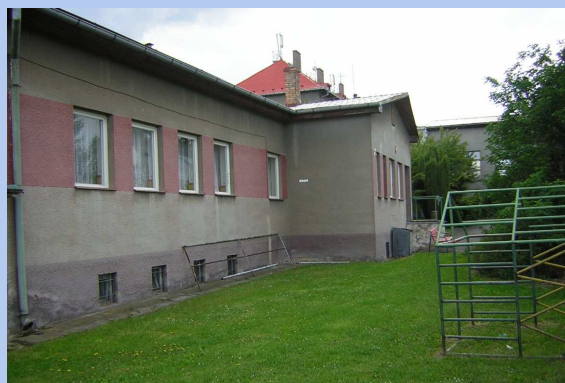
Budova Mateřské školy

Strategický plán rozvoje městyse je veřejným dokumentem, který najdete na webových stránkách a můžete se k němu průběžně vyjadřovat.