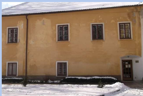
Budova Úřadu městyse – bývalý klášter

Na realizaci uvedených projektů průběžně žádáme o dotaci z různých dotačních titulů.